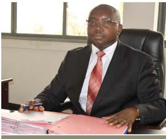
Par Léonard Sentore, COMMISSAIRE GENERAL

Dans cette optique, le présent Magazine montre à suffisance que la maximisation des recettes est le résultat d'une combinaison de plusieurs stratégies parmi lesquelles un travail de protection des recettes qui se traduit par une lutte constante et acharnée contre la fraude et la corruption. Pour atteindre ce noble objectif, l'OBR a notamment renforcé les services de son Commissariat en charge des Enquêtes, Renseignement et Gestion du risque d'une part ; et a mis en place une stratégie de lutte