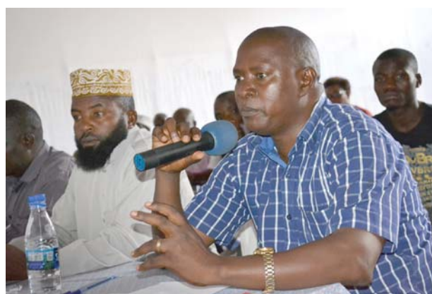
Un participant à l'atelier pose des questions et émet des suggestions

Pour l'Administrateur de la Commune Kayanza, l'évènement est arrivé à point nommé car les échanges contribuent à éclairer les contribuables sur le rôle combien important de l'impôt dans développement socio-économique du pays. Dans son intervention, l'administrateur de la commune Kayanza s'est penché sur la fraude qui s'observait dans le passé, mais qui est actuellement en régression parce que l'administration y a mis le paquet pour la combattre notamment au niveau de la contrebande du coltan vers le Rwanda. Quant à ceux qui continuent à contourner le fisc, une