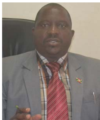
Gad Niyukuri, Gouverneur de Makamba

A Makamba, un commerçant rencontré au marché du chef-lieu dit qu'il sait que l'importation légale est nécessaire et obligatoire pour soutenir les efforts au développement, mais demande « que les taux soient revus à la baisse pour que les tentatives de fraudes diminuent et ne soient plus nécessaires ».