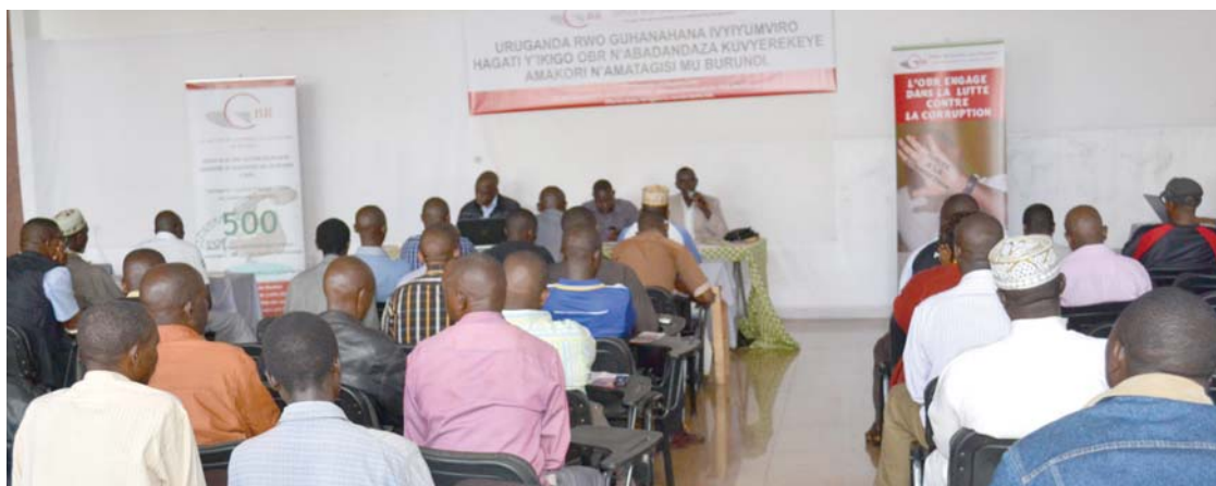
Vue partielle des participants à la réunion

L'Office Burundais des Recettes a organisé un atelier de sensibilisation des contribuables à Kayanza. L'Administrateur de la Commune Kayanza et le Conseiller Economique du Gouverneur de la province y ont également pris part. Il s'agit d'un atelier d'échanges sur la conformité fiscale qui aide les contribuables à comprendre et à s'acquitter volontairement de leurs obligations fiscales.