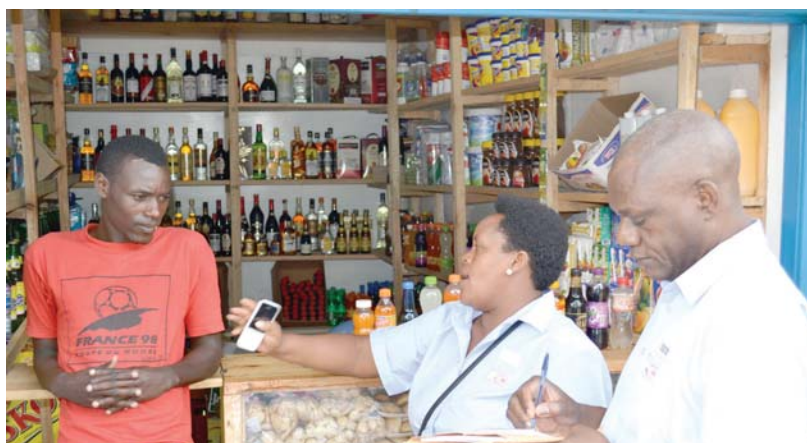
visite porte-à-porte dans le centre commercial de Kayanza

Dans son allocution d'ouverture, Le Conseiller économique du Gouverneur a parlé de la fraude douanière et fiscale qui sont des fléaux comme la corruption. Il existe beaucoup de contribuables dans la province de Kayanza qui sont appelés à quitter l'informel et travailler dans le formel.