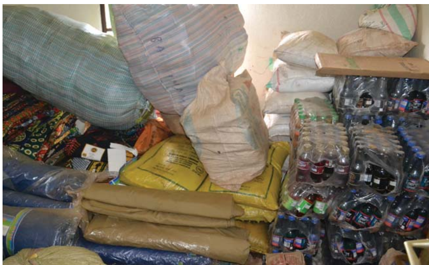
Fraude saisie en province Muyinga

L e Commissariat des Enquêtes, Renseignement et Gestion du risque, voici la dénomination d'un service de l'OBR spécialisé dans la protection des recettes par une lutte acharnée contre la fraude fiscale et douanière. Mise en place avec la nouvelle administration fiscale, ce Commissariat est doté de trois directions bien séparées pour mener sa mission de façon la plus efficace possible. Nous avons une Direction chargée des enquêtes sur les cas de fraude fiscale et douanière, une Direction chargée des renseignements et de la gestion du risque et une Direction de l'Intervention Rapide et Services de police. Celle-ci coiffe deux services à savoir le Service d'Intervention rapide et celui de l'Unité de Police.