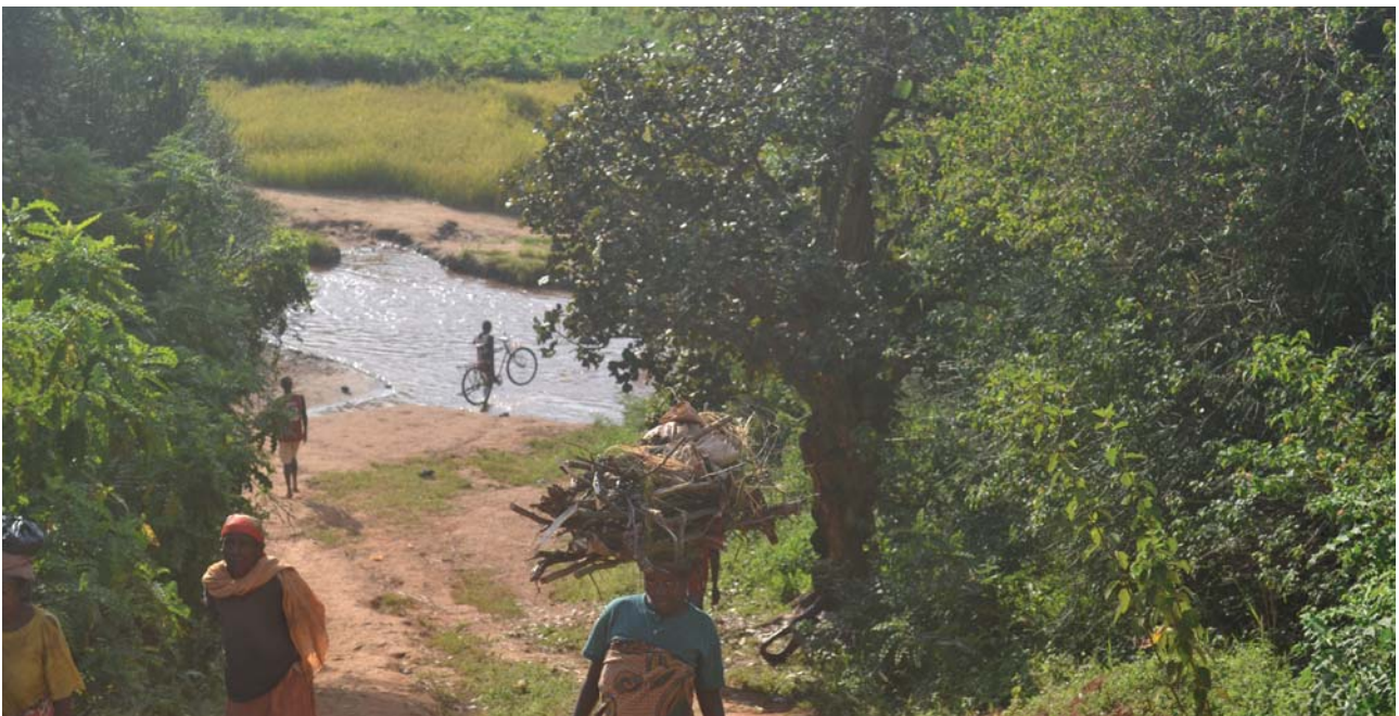
Sentier utilisé par les fraudeurs à Murama à Muyinga

Les commerçants transfrontaliers disent être malmenés par les différentes institutions du Gouvernement : « on ne sait pas quoi faire quand la Brigade Anti-Corruption ou la Police Nationale saisissent nos marchandises et s'en emparent. On est dépassé ».